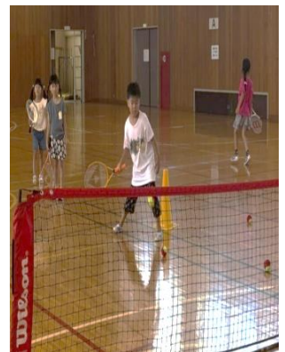
藤枝市立岡部小学校