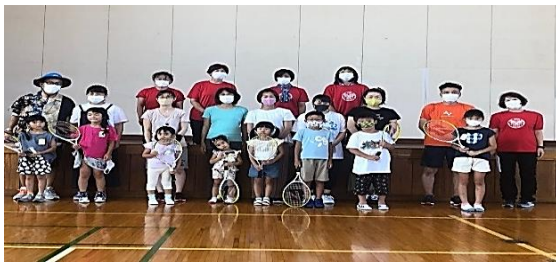
新橋体育センター